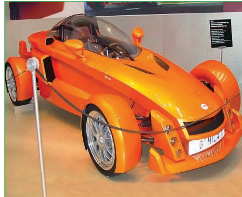
Smart hibrid-aracılar 2006