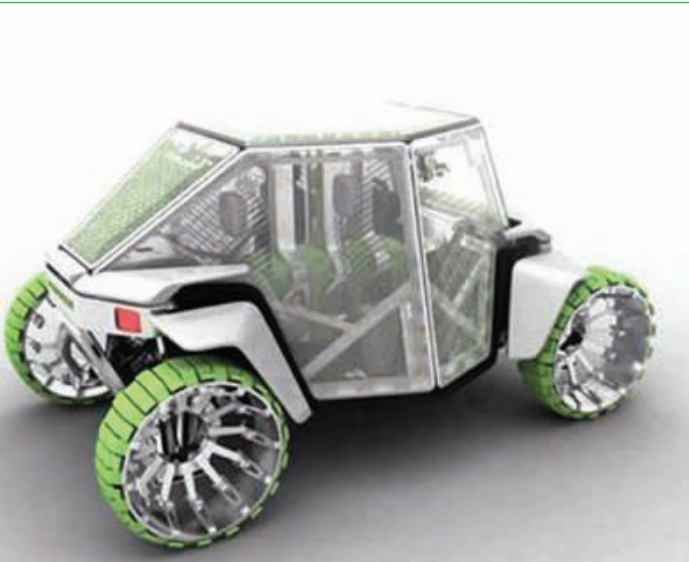
O 2 Hummer geleceğin oksijen üreten otomobili 2006

Bir başka yaratıcı örnek de, California'dan Volkswagen tasarım grubunun çalışması. Nanoteknolojiyi hücre teknolojisi ve Güneş enerjisiyle birleştirerek kullanılan modern bir taşıt olarak düşünülen "Nanospyder", üç genç tasarımcı tarafından Volkswagen Tasarım Merkezi için Santa Monica'da geliştirilmiş. Bu tasarım çevreye zarar vermeyen alternatif enerji kaynaklarının kullanımını özendirilen, elektrik enerjisiyle hareket eden, şişme gövdeli ve iki kişilik bir konsept araç olarak Los Angeles Otomotiv Fuarı'nda ilk defa yer aldı.