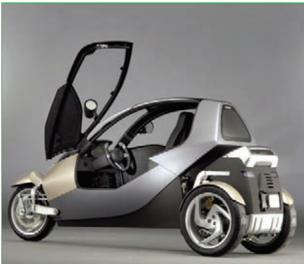
"Clever" İngiltere'de tasarımcılar tarafından geliştirilmiş bir üç tekerlekli konsept araç.

Diğer bir örneğimiz, yine Avrupa'dan üç tekerlekli çevre dostu bir konsept araç. İngiliz tasarımcılar tarafından geliştirilen "Clever", özellikle şehir içi park sorununa yaratıcı bir çözüm olarak karşımıza çıkıyor. Avrupa Birliği fonları çerçevesinde, BMW tarafından finanse edilen Ar-Ge çalışmasıyla özellikle trafik sorunlarına alternatif çözüm içeren bir potansiyel çalışma olarak önümüzdeki 5 yıl içinde kentlerde yerini alacak gibi gözüküyor.